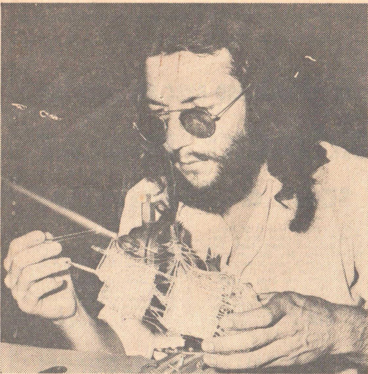
Démonstration d'un artisan souffleur de verre